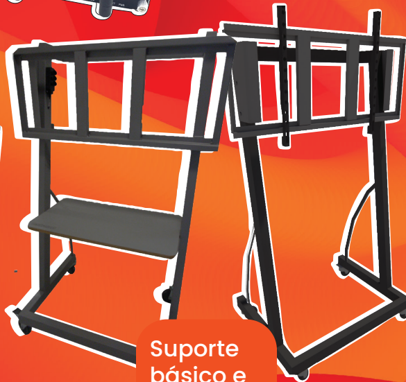
Suporte básico e prateleira