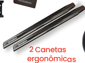
2 Canetas ergonômicas