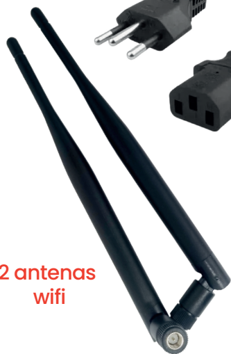
2 antenas wifi