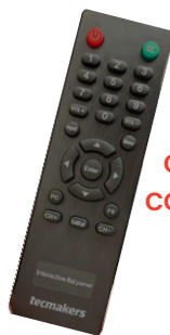
controle com pilhas