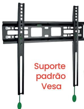
Suporte padrão Vesa