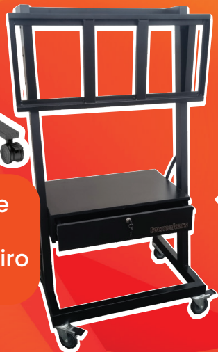
Suporte com gaveteiro