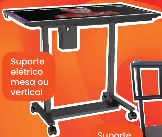
Suporte elétrico mesa ou vertical